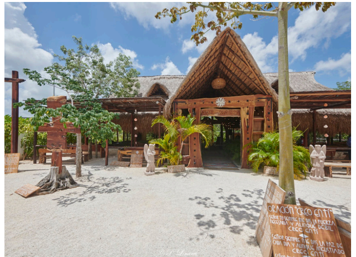
Santuario de María Desatadora de Nudos