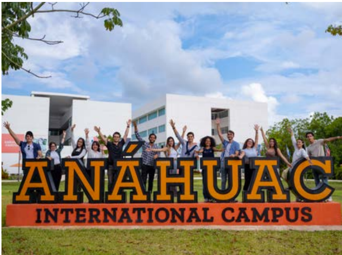
Anahuac Cancun - Campus internacional