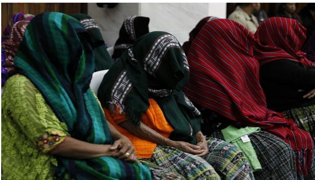
Las mujeres víctimas de Sepur Zarco esperando la sentencia en el Tribunal

En Guatemala, la justicia condenó en febrero, a 120 y 240 años de prisión respectivamente, al teniente Coronel Esteelmer Francisco Reyes Girón y al ex comisionado militar Heriberto Valdez Asig por delitos de lesa humanidad con la modalidad de violencia sexual y esclavitud doméstica y sexual. Fue el primer caso de violencia sexual vinculado con el conflicto armado interno juzgado por un tribunal guatemalteco. Las víctimas eran 15 mujeres indígenas de la etnia Q'eqchi', a las que sometieron a violación sexual, trato humillante y servidumbre doméstica en un destacamento instalado en Sepur Zarco.